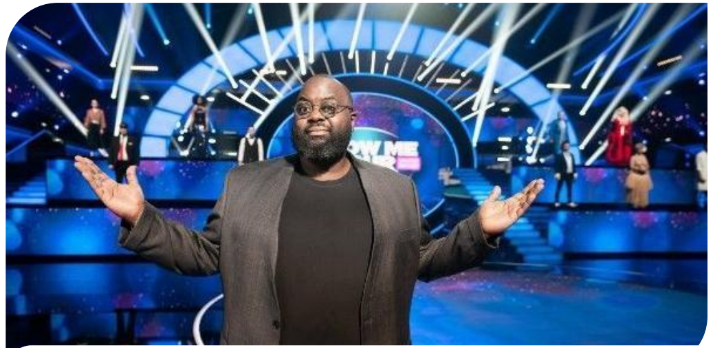
La prochaine émission de « Show Me Your Voice » sera diffusée le 13 mai à 21h05.

« Imaginez que vous êtes réunis en famille et que vous faites un Cluedo musical : il va falloir démasquer les gros criminels de la chanson ! Show Me Your Voice , c'est un peu ça. Deux candidats doivent, parmi 9 chanteurs mystères, deviner qui sont les vrais chanteurs et qui sont les imposteurs, sans entendre le son de leur voix. Aidés par des célébrités comme Claudio Capéo ou Éric Antoine, ils mènent l'enquête pour démasquer le chanteur ou le menteur. Parmi les interprètes, il y a une professeure d'anglais, un infirmier, un carrossier... »